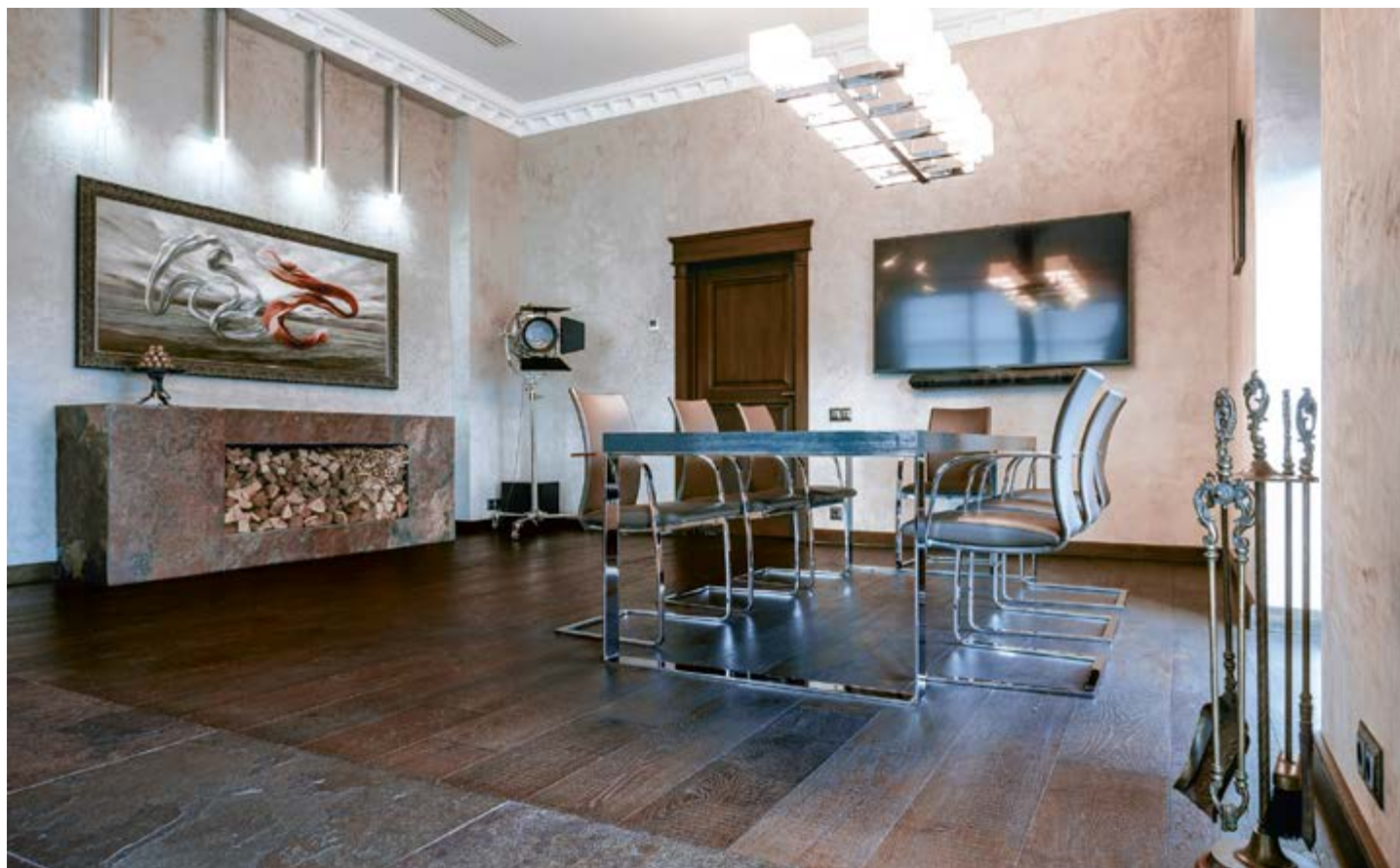
Плитка Porcelanosa (салон «Бомонд») в переговорной комнате продолжает переключку натурального камня и дерева, начатую в оформлении кабинета. Дровник, отнёсённый далеко от каминной зоны, поддерживает идею. Картина над ним — работа Дмитрия Кочановича, выполненная на заказ специально для проекта.