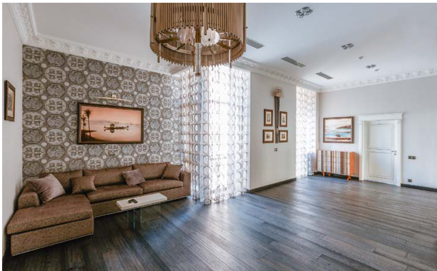
В зоне отдыха — диван и неожиданно тёплая для морского пейзажа картина Дмитрия Кочановича, эффентно работающая с общей сдержанной цветовой гаммой интерьера. Обои — Prospero (салон Alchimia). Светильники — SigmaL2.