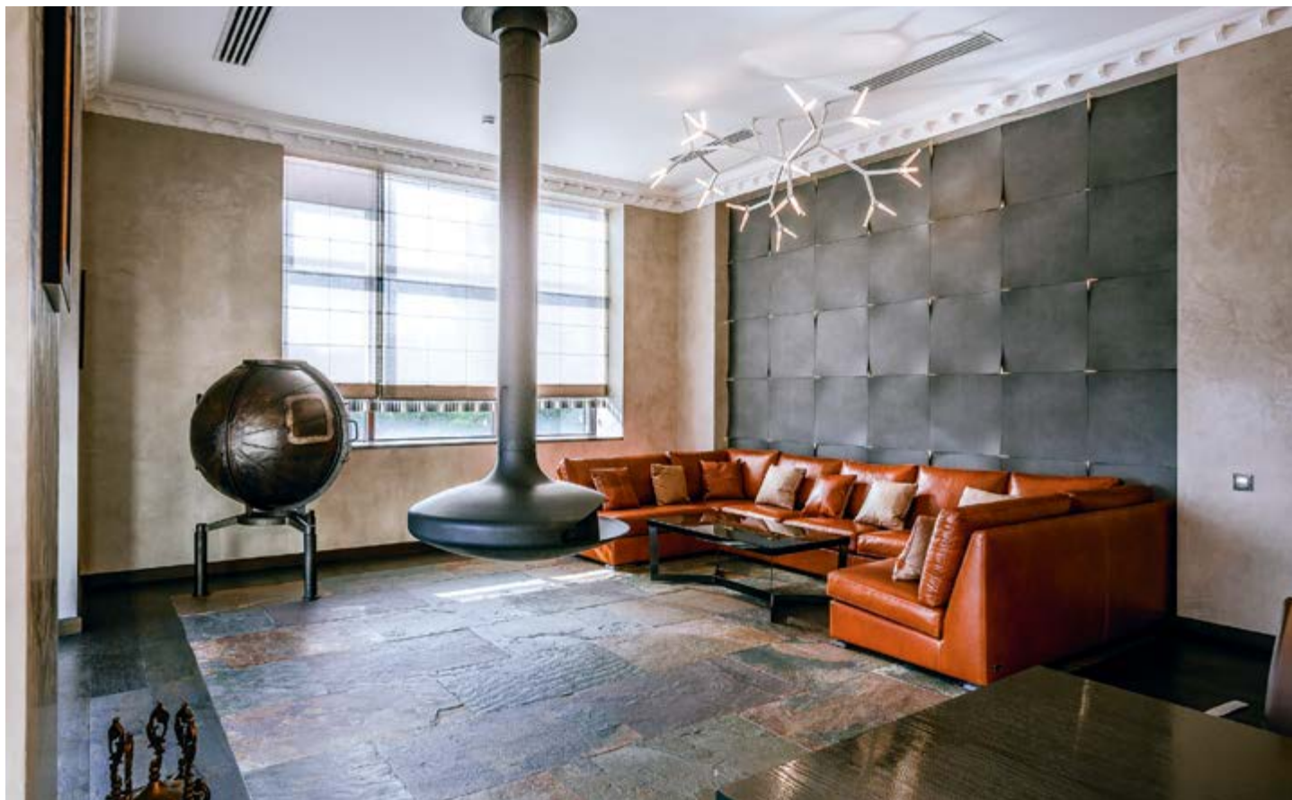
Рыжий кожаный диван и камин Gyrofocus от Focus (салон «Арт Рум») — ещё одна яркая отсылка к мужской теме, которую хотелось отразить в интерьере всего офиса: игра в ассоциации — краги, кожаные портсигары. Бар в форме батискафа — Restoration Hardware, журнальный столик — Rada (салон 1998). Свет — Sparks от Quasar.