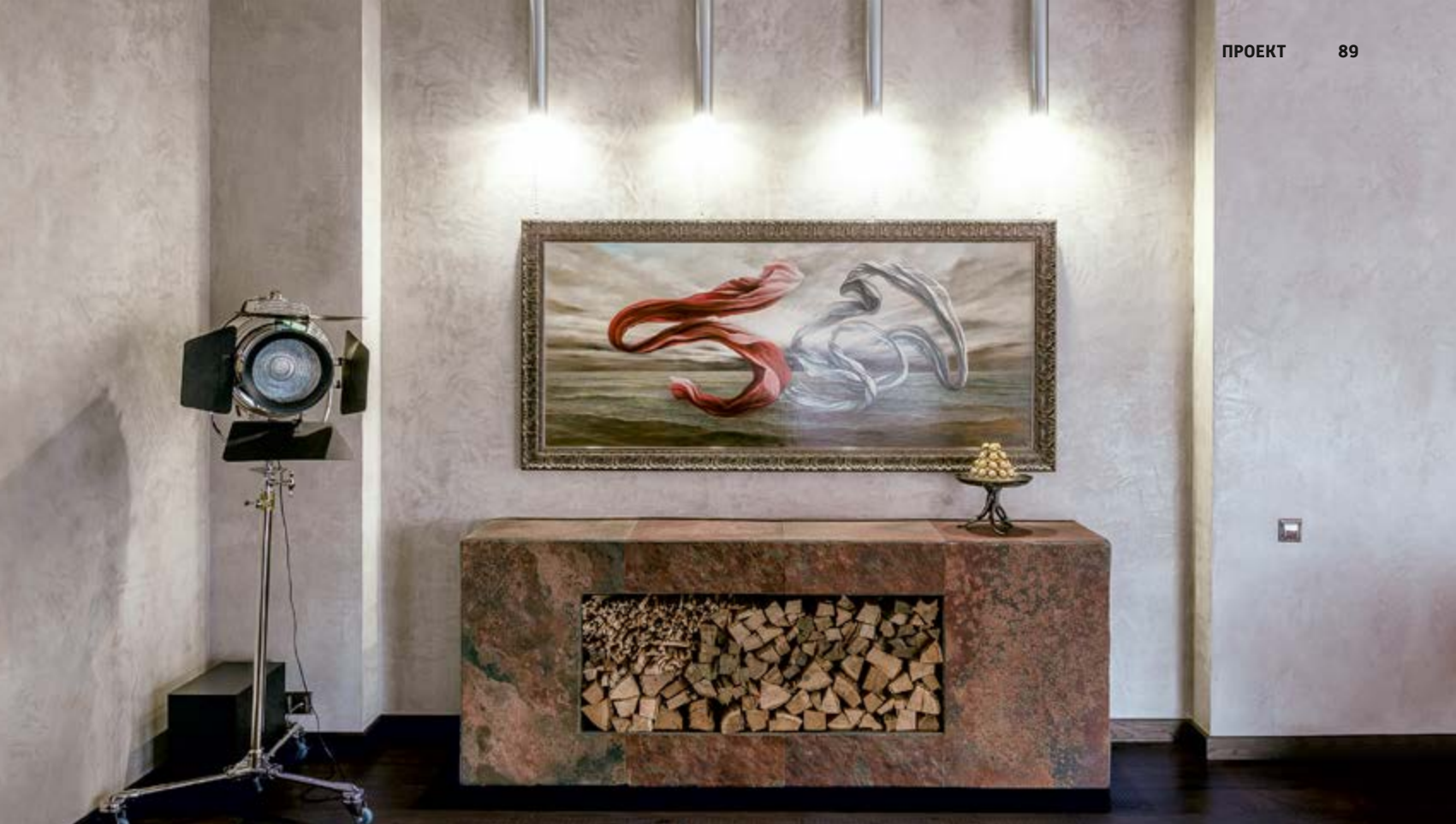
Декоративное покрытие стен — Андрей Кабицца; материал — Oikos. Напольный светильник — Eiccholtz (салон «1998»).

Пространство разделено на три основные зоны: рабочий кабинет, переговорную и комнату отдыха. Основной концепцией оформления интерьера стало единодушное решение заказчика и дизайнеров отойти от стандартов и создать пространство с характером. Так, кабинет обзавёлся лаконичными белыми стенами. Они не выглядят скучно: текстурная штукатурка с едва уловимым перламутровым блеском, классическая лепнина и карты из гипса смотрятся контрастно с рабочим столом футуристического абриса. Переговорная комната лишена привычных атрибутов в виде трибуны для спикера и длинного стола. Элегантный современный стол дополнен подвесным камином и баром ручной работы в форме батискафа, дровником из камня, гравюрами и живописью. Всё это создаёт атмосферу дорогого мужского клуба, располагающую к непринуждённому общению. Комната отдыха — это наиболее личное пространство во всём офисе. Сдержанная монохромность общего цветового решения разбавлена ярким, оригинальным комодом, объединённым общим ритмом и цветовым решением с картиной Дмитрия Кочановича. К слову, все три картины в проекте были написаны художником на заказ, специально для этого интерьера под руководством дизайнеров. Законченность интерьеру придают старинные гравюры, приобретённые владельцем во время путешествий. Дизайнерское оформление произведений искусства позволяет безукоризненно вписать их в интерьер. Работа с антикварными и современными произведениями высокого художественного уровня — отличительная черта всех работ Наталии и Дарьи.