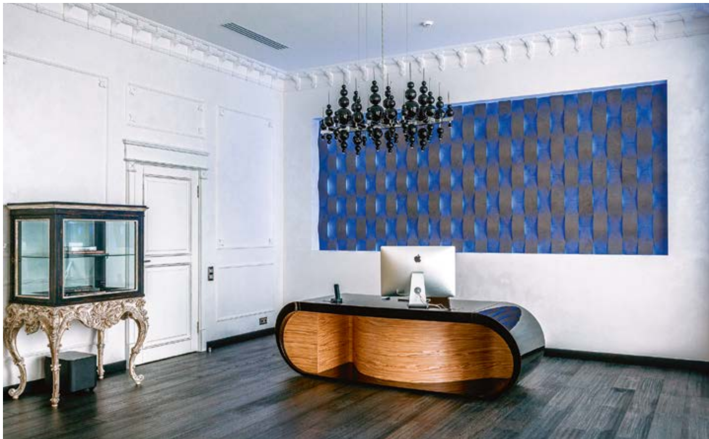
Брашированные полы Euro Covering (салон «Бомонд»), потолки с гипсовой лепкой (декор-центр Oikos), классическая витрина и современный дизайн рабочего стола с высокотехнологичным панно из плитки Aravisa (салон «Бомонд») — такой рабочий кабинет уверенно нарушает границы общепринятого официоза, оставаясь в рамках этики делового пространства.